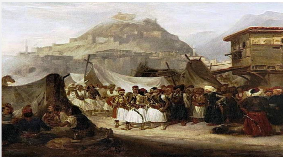
Theodore Leblanc - Camp Des Grecs Palikares Devant Lepante 1827●