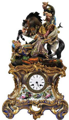
Η μονομαχία του Γκιαούρ και του πασά. Επιτραπέζιο ρολόι από πολύχρωμη πορσελάνη, 1830