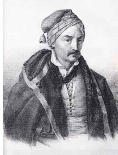
Κανάρης. Λιθογραφία. του Κ. Krazeisen

«Μάχου υπέρ πίστεως και Πατρίδος... Είναι καιρός να αποτινάξωμεν τον αφόρητον ζυγόν, να ελευθερώσωμεν την Πατρίδα, να κρημνίσωμεν από τα νέφη την ημισέληνον, δια να υψώσωμεν το σημείον, δι' ου πάντοτε νικώμεν, λέγω τον Σταυρόν...».