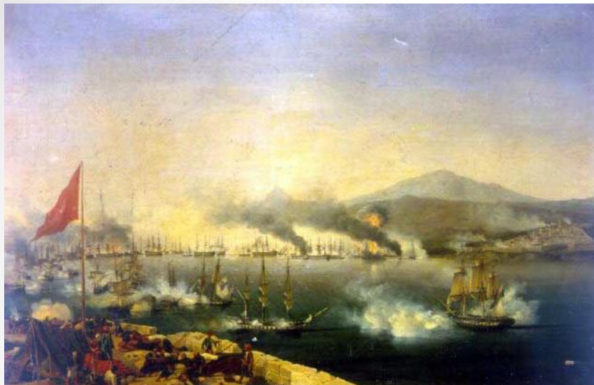
Carneray, Η ναυμαχία του Ναβαρίνου.

Η εξέλιξη της Ελληνικής Επανάστασης μεταδίδονταν άμεσα από ανταποκριτές της Σμύρνης και της Κωνσταντινούπολης μέσω ελληνικών πλοίων που ταξίδευαν από την Οθωμανική Αυτοκρατορία στην Ευρώπη και στην συνέχεια από τους Έλληνες φοιτητές που σπουδάζαν εκεί. Τα νέα προωθούνταν στις εφημερίδες.