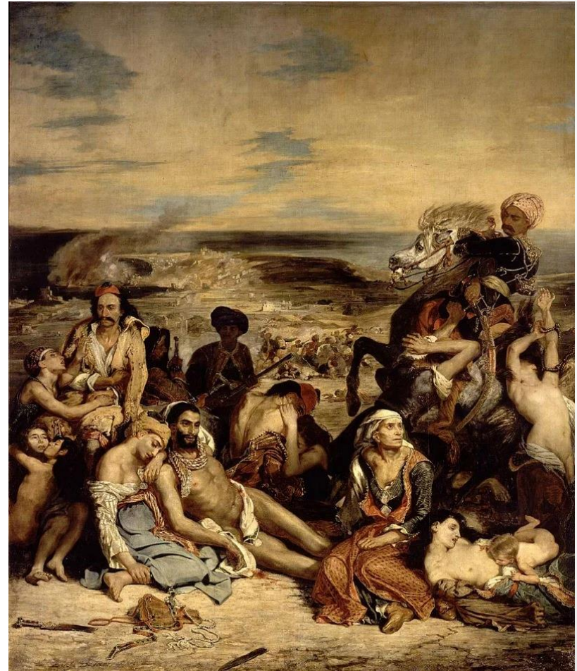
Ευγένιος Ντελακρουά: Η σφαγή της Χίου

Ένας από τους πίνακες που έκαναν αίσθηση στην Ευρώπη, ήταν η σφαγή της Χίου, του Ευγένιου Ντελακρουά. Ένας πίνακας που αργότερα αγοράστηκε από τη γαλλική κυβέρνηση για 6.000 φράγκα και περιγράφει με ωμότητα τα όσα συνέβησαν στο νησί του Αιγαίου. Η αγριότητα των Τούρκων σοκάρει τους Γάλλους που ζητούν την παρέμβαση της κυβέρνησής τους.