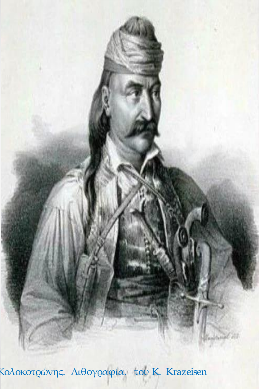
Κολοκοτρώνης. Λιθογραφία. του Κ. Krazeisen

Οι Έλληνες προσωπογράφοι, όπως είναι ο Τσόκος, ο Προσαλέντης και ο Λεμπέσης, για τα πορτρέτα των Αγωνιστών, συχνά βασίζονται σ' αυτά τα αρχικά σκίτσα των φιλελλήνων. Ακόμα και στο πεντοχίλιαρο του 1984 η πασίγνωστη μορφή του Κολοκοτρώνη βασίστηκε σε σχέδιο του Κράτσαϊζεν.