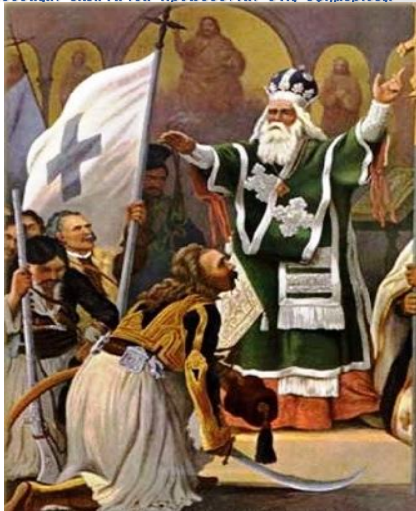
Peter Von Hess Ο μητροπολίτης Γερμανός ευλογεί τη σημαία της ελευθερίας

Ο Βαυαρός ζωγράφος Πίτερ φον Ες (Peter Von Hess 1792 - 1871) ζωγραφίζει την επανάσταση, σαν πολεμικός ανταποκριτής.