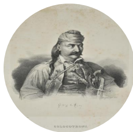
Θεόδωρος Κολοκοτρώνης, 1828