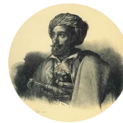
Ιωάννης Μακρυγιάννης, 1828