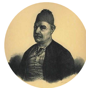
Ανδρέας Μιαούλης, 1829